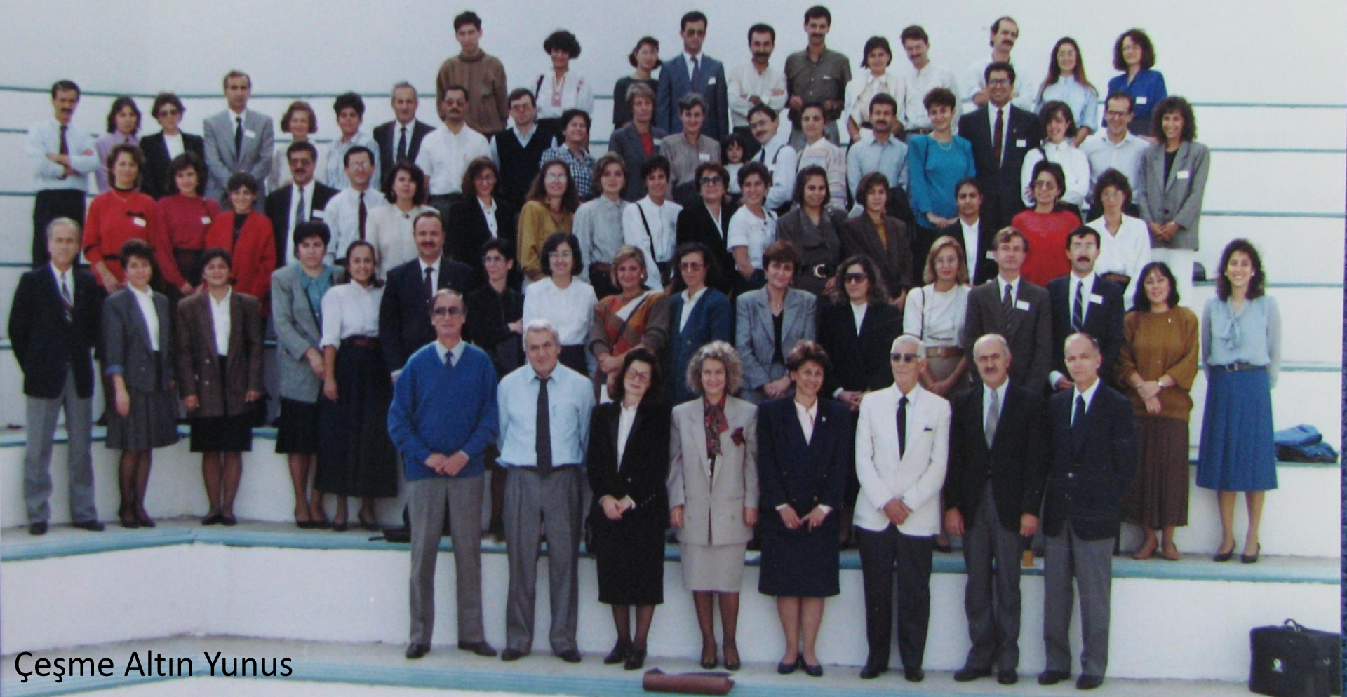
Çeşme Altın Yunus