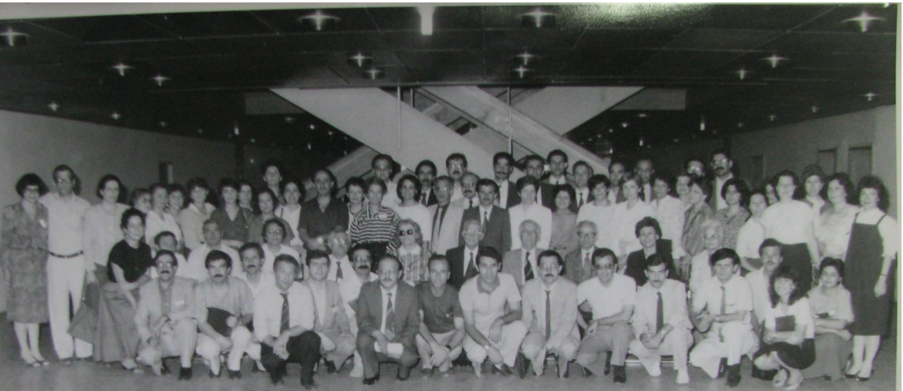
VI. ULUSAL PATOLOJİ KONGRESİ 28-30 Mayıs 1984 İZMİR