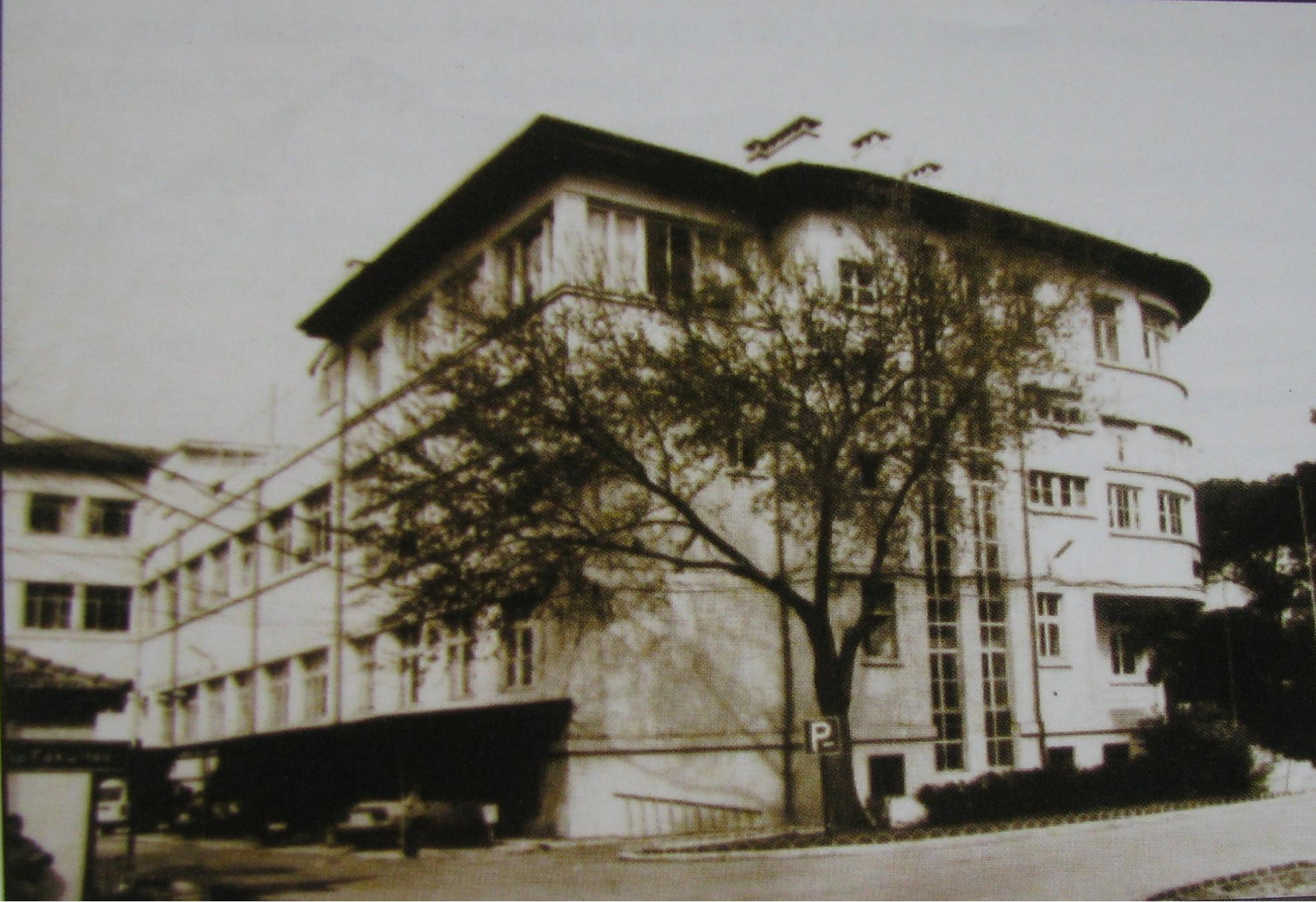
EGE ÜNİVERSİTESİNİN İLK ANA BİNASI