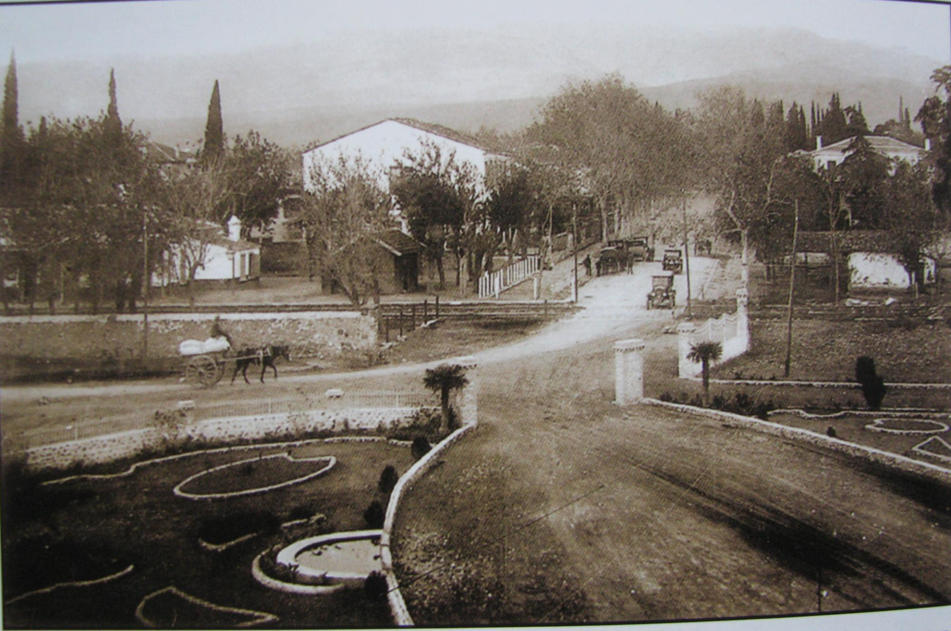
Resim 2-3: Bornova - İstasyon Caddesi, Pandispanya Köşkünden Mahfel'e doğru bir bakış 1930'lu yıllar.