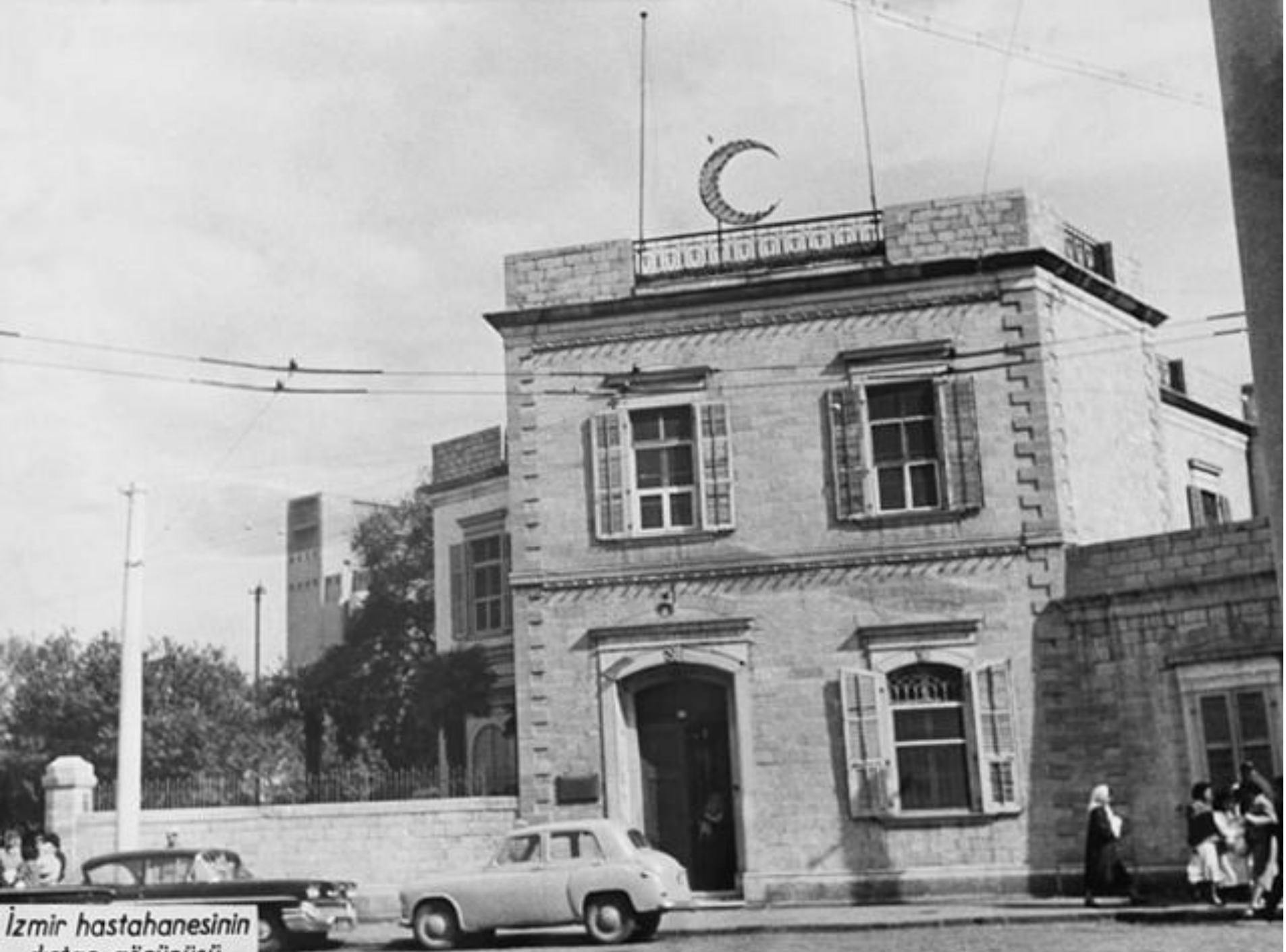
İzmir hastahanesinin dıştan görünüşü